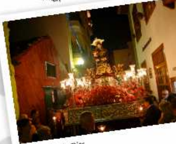
Gran Poder de Dios