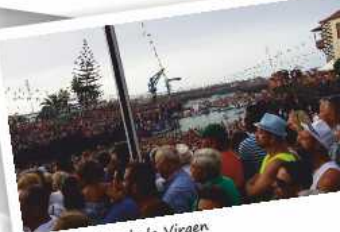
Embarcación de la Virgen