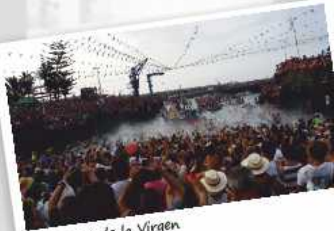
Embarque de la Virgen