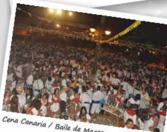
Cena Canaria / Baile de Magos