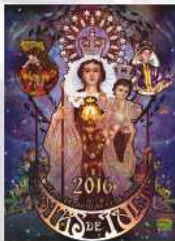
"FLOS NASCITUR IN MARE" Autor: Sergio García del Pino