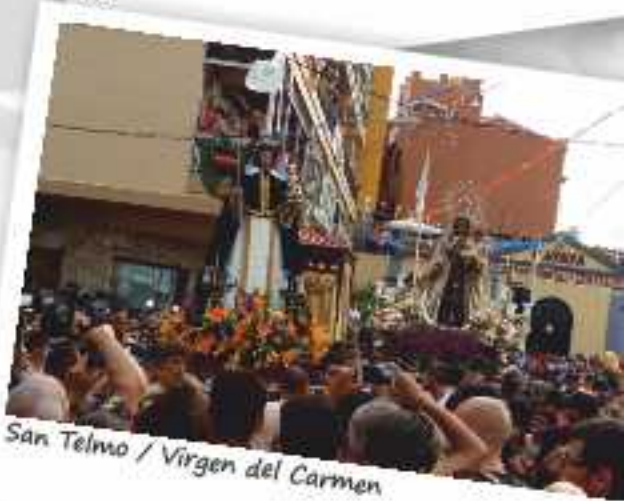
San Telmo / Virgen del Carmen

Diseño, maquetación e impresión: Imprenta Newy's