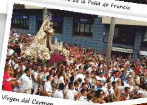
Virgen del Carmen