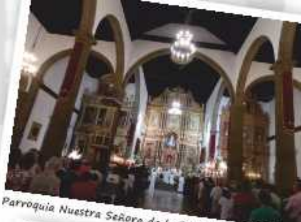
Parroquia Nuestra Señora de la Peña de Francia

11.00 h.- MISA EN ACCIÓN DE GRACIAS EN HONOR AL SEÑOR DEL GRAN PODER DE DIOS. Presentación de ofrendas. Intervendrá en el acto litúrgico el Coro del Sagrado Corazón de Jesús. Al finalizar la Eucaristía, tendrá lugar la entrega de los Galardones "Gran Poder de Dios", en su I Edición, en reconocimiento a los devotos del Señor que han prestado su continua y desinteresada colaboración a Su Venerable Hermandad. A continuación, Solemne Procesión con el Señor por las calles y plazas de la ciudad.