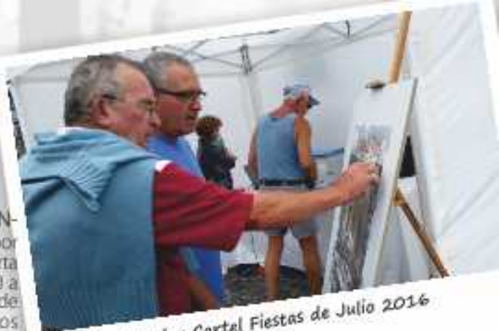
Votación Popular Cartel Fiestas de Julio 2016

19:00 h.- APERTURA DE LA EXPOSICIÓN DE FOTOGRAFÍAS Y AUDIOVISUALES "FERVOR Y TRADICIÓN" de José David del Castillo. Biblioteca Pública Tomás de Iriarte. Permanecerá abierta hasta el 8 de julio en horario de 09:00 a 20:30 horas. Organiza: Agrupación de Hermandades y Cofradías "Santo Madero", Biblioteca Pública "Tomás de Iriarte" y Ayuntamiento.