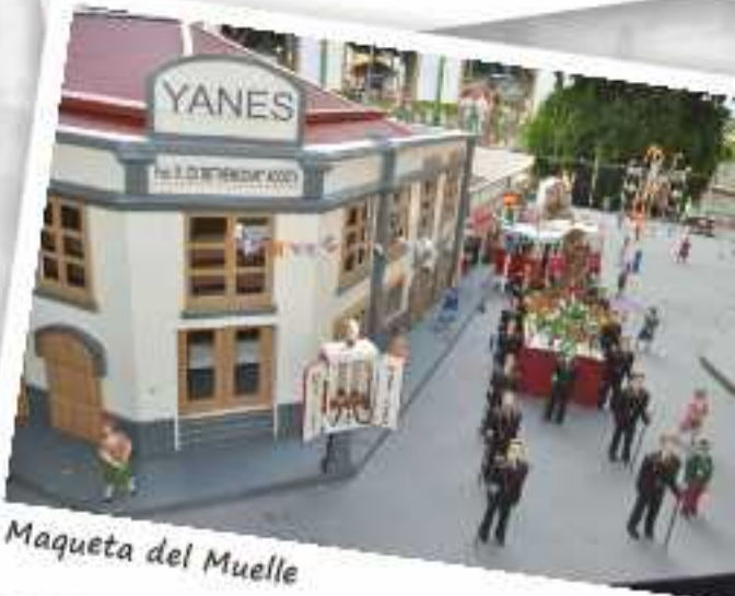
Maqueta del Muelle